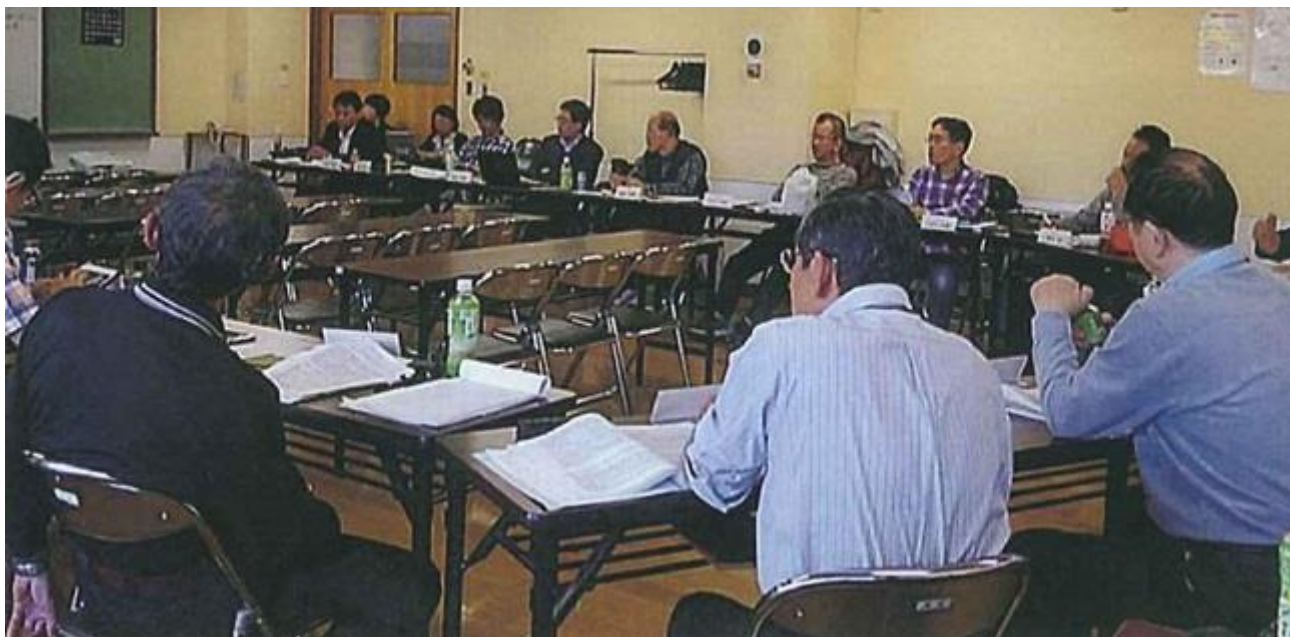
一般社団法人移行後初の2日間にわたる理事会の様子

財務面では会費問題、会員減小傾向に関しては特効薬のような提案は無く、地道な日常活動を積み重ねることの重要性を確認しました。財務基盤強化では収益事業の展開についても意見を交換し、来年度予算に盛り込む予定です。その他では全難聴・全要研の両代表名による「要約筆記利用時のルールや用紙、ログの扱いについて」の統一見解の文書に対して理事会の承認をいただきました。