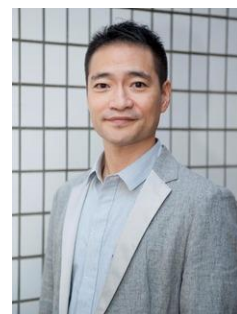
星野 智幸氏 小説家